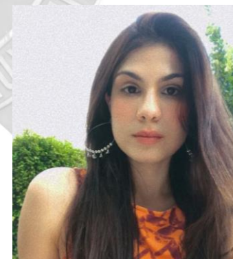
Tassiani Santos Organização