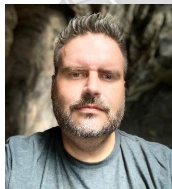
Rodolfo Ferrari Organização